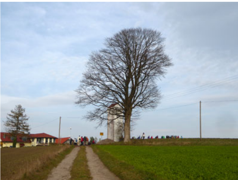
Von dort war es nicht mehr weit nach Wiesenfelden.